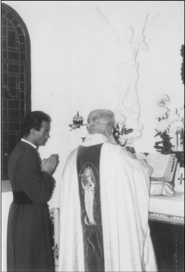
Ministrálás Kentenich atya mellett