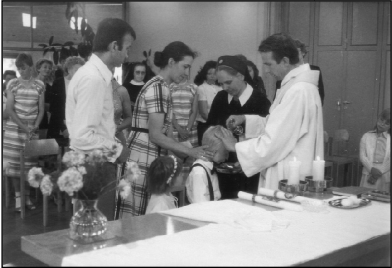
Keresztelő Tilmann atyával