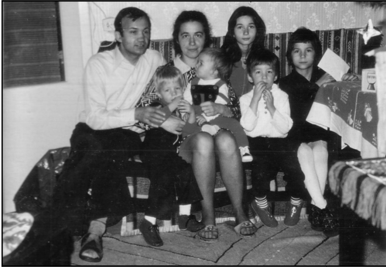
A teljes Górány család