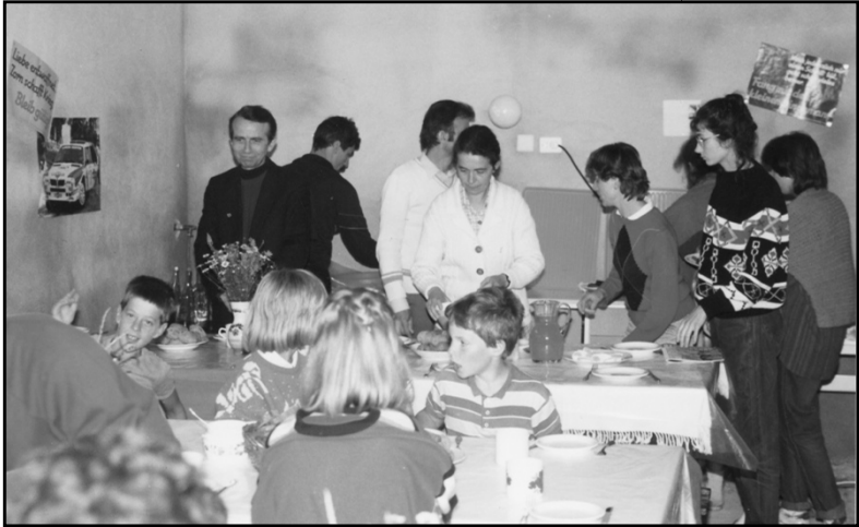
Első családnapok a nagy házban