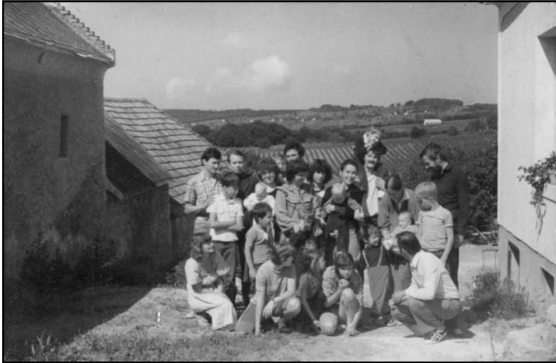
Az első magyar családnapok