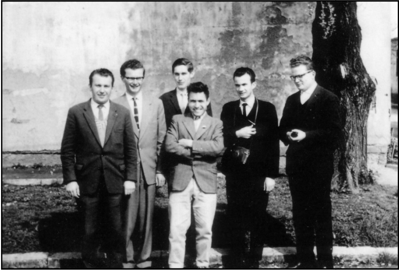
A kispapokkal Schönstattban