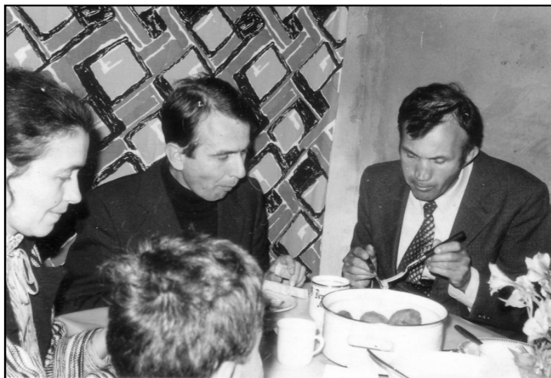
Tilman atya látogatóban