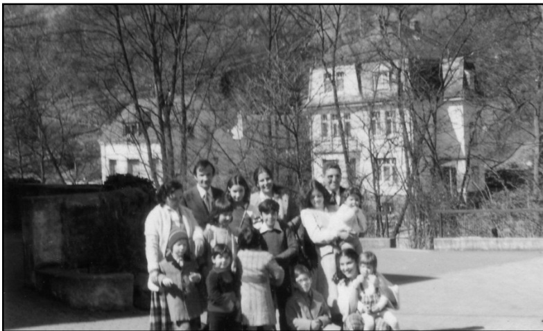
A költözés előtt utoljára Schönstattban (éppen egy mexikói családdal)