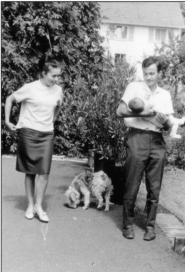
Az első gyermek