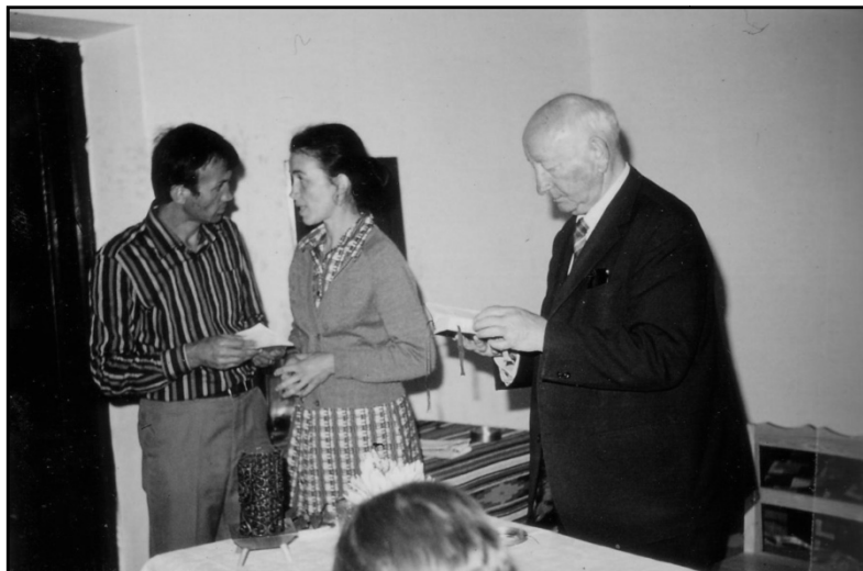
Tick atya látogatóban