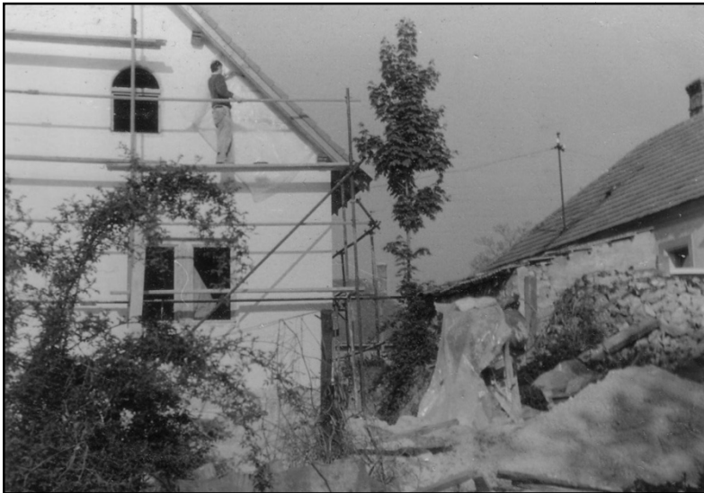
Az épülő nagy ház