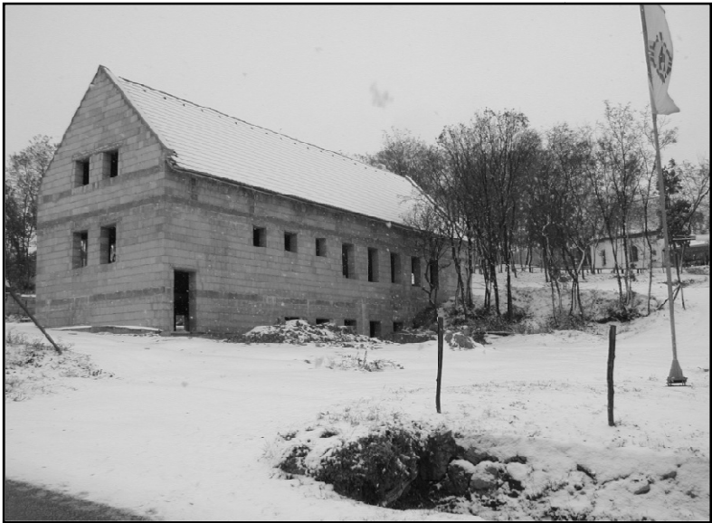
A központ épülőfélben