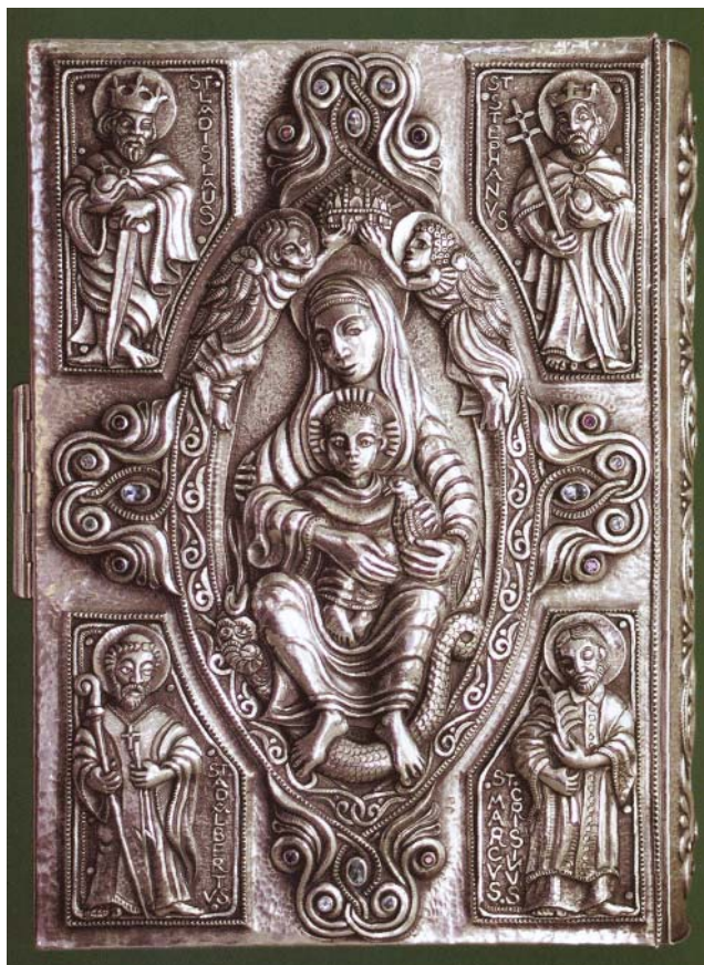
Evangelárium (Ozsvári Csaba, Esztergom, 1997)

Kentenich atya: Tartsd a jogart (Az Ég felé c. imakönyvből)