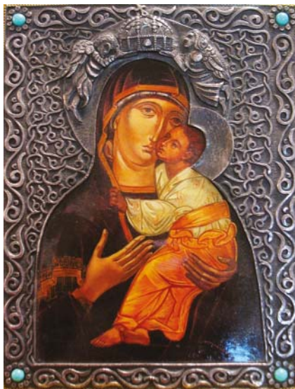
Ikon (az Ozsvári házaspár készítette Michels Antal atyának 1996-ban)

Szent István királyunk felelős utód hiányától szenvedett. Ebben a helyzetben fordult a Szűzanyához és a Magyarok Nagyasszonyává koronázta Őt. Azóta Magyarország több nagyhatalom igáját túlélte.