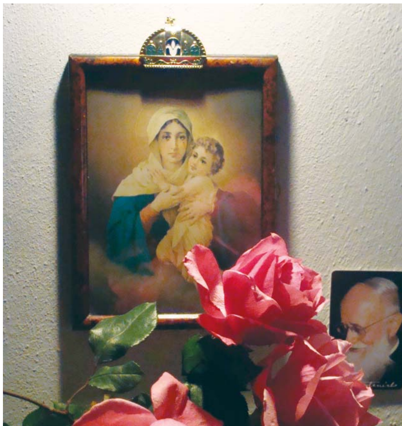
Háziszentély egy családnál

Úrnőm és Anyám, egészen följánlom magamat Neked. Odaadásom tanúsítására ma Neked szentelem szememet, fületem, számat, szívemet és egész lényemet. Mivel tehát a Tied vagyok, jó Anyám, őrizd meg engem és oltalmazd, mint birtokodat és tulajdonodat. Ámen