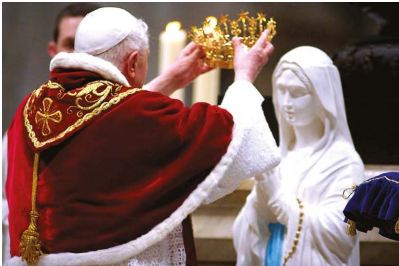
XVI. Benedek pápa megkoronázza a Lourdesi Kegyszobrot 2007-ben

Megrendítő a II. János Pál pápáról szóló történet is, ami az ellene elkövetett merényletről szól: 1981. május 13-án, abban a pillanatban, amikor a támadó elsütötte a fegyvert, egy kislány a tömegben felemelt egy képet, hogy a Szentatya áldja meg. A pápa lehajolt, hogy megáldja a képet. Ebben a pillanatban süvített el a feje mellett a golyó és egy apáca karjába fúródott. A második lövés a semmibe ment. Ezután elvesztette türelmét a merénylő, és harmadszorra hasba lőtte. Négy napig tartott, amíg az operáció után felébredt. Azt mondták neki az orvosok, hogy a golyó a testében elkanyarodott, mintegy kikerülte a fontos szerveit. Olyan volt, mintha egy kéz átirányította volna. Az a kép, amelyet abban a pillanatban a Szentatya megáldott, a Fatimai Szűzanya képe volt. A Szentatya biztos volt abban, hogy a Szűzanya mentette meg az életét, és hálából elzarándokolt Fatimába. Azt a golyót, ami a testében volt, egy koronába dolgoztatta bele, és a Szűzanyának ajándékozta.