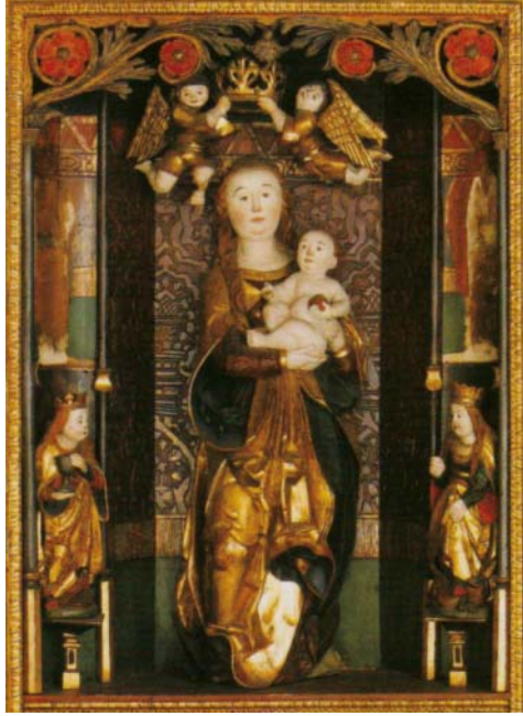
A csikmenasági Szűz Mária-oltár

Anyai szívedre hivatkozom és Jézusra, az örök bölcsességre, s alázattal kérlek, eszközöld ki számomra hathatós közbenjárásod által a Szentlélek bőséges kegyelmét, hogy elmémvel helyesen fogjam föl, és a gyakorlati életben