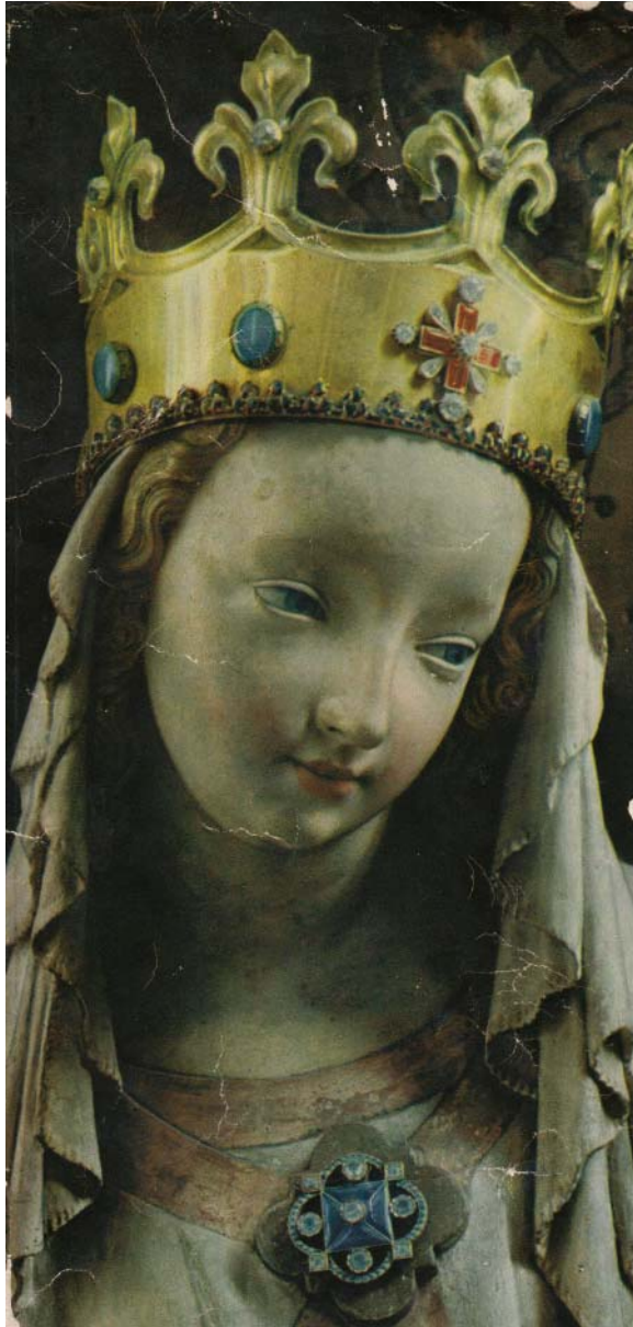
A pilseni Szent Bartolomeus-templom Mária-szobra