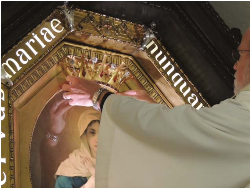
A schönstatti Szűz Mária megkoronázása (Schönstatt, összentély, 2014)

Üdvözlégy Királynő, nagy irgalmasság Anyja, élet, édesség, boldog remény, áldunk. Hozzád kiáltunk Évának száműzött fiai, hozzád fohászkodunk sóhajtva, zokogva, hozzád, e siralomvölgyben. Kérünk tehát, kegyes közbenjárónk, fordítsd felénk mindenkor éber szemedet üdvösségünkre. És Jézust, anyaságod áldott, szent gyümölcsét, nekünk e földi út végén mutasd meg. Ő áldott, ó édes, ó jóságos szép Szűz Mária!