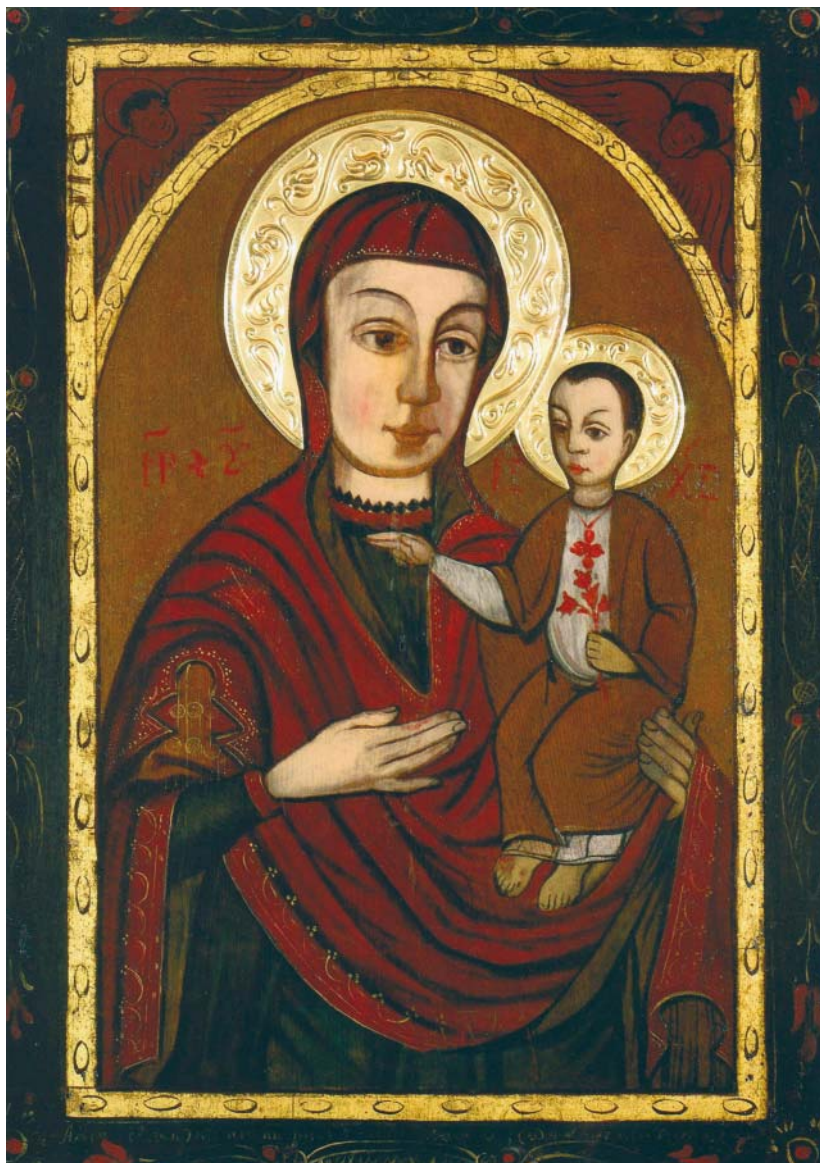
A máriapócsi kegykép