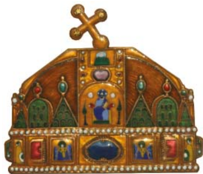
Az óbudavári Schönstatt-kápolnához készített magyar korona (Zoltán Győző és Mária ötvösművészek munkája. Tűzzománc, 2014)

A magyar Schönstatt-család az óbudavári kápolnában levő MTA kegykép megkoronázásra készül. E kiadvány célja a lelki készüllet elősegítése, az esetleges felmerülő kérdések megválaszolása, és a segítségnyújtás abban, ha a közös koronázási gesztust egy saját szívbéli, vagy otthon a háziszentélyben zajló koronázással előzzük meg, és készítjük elő.