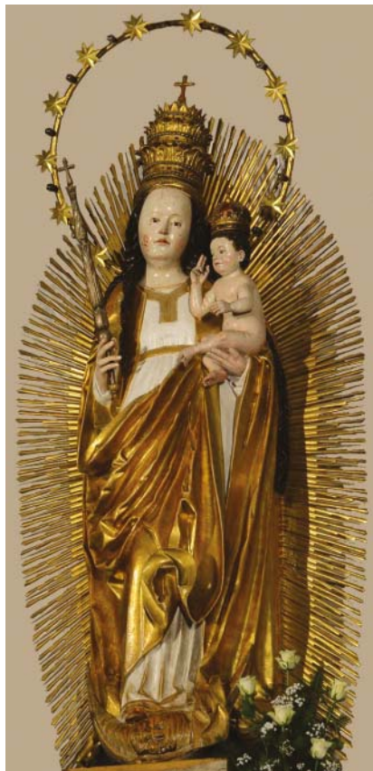
A csíksomlyói Szűzanya kegyszobra

Ha mi mindannyian megvalósítottuk a koronázást, akkor fel kell tennünk magunknak azt a kérdést is: Hogyan biztosíthatjuk most e koronázás hatását és megmaradását? A Szűzanya megkoronázásának gondolata a középkorban szintén nagyon elterjedt volt. Elcsodálkozunk azon, hogy a mai katolikus ember milyen keveset tud az ilyen szimbolikus cselekményekről. A Szűzanya a „Mi Asszonyunk” is, a mi királynőnk. Szent Atanáz mondja egyszer: Magától értetődik, hogy ha Krisztus a világ ura, akkor a Szűzanya kell, hogy legyen a világ királynője. Szent Bernát mondja: Mindaz, ami az élő Istenhez tartozik, az egyidejűleg az Ő édesanyjához is tartozik. És ha Krisztus Isten, és Isten minden teremtmény felett, akkor magától értetődik, hogy a Szűzanya minden teremtmény királynője.