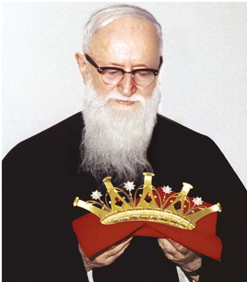
Kentenich atya egy koronával a kezében

lalta, hogy a dachauai koncentrációs táborba szállítsák. A schönstatti család talált egy orvost, aki hajlandó lett volna Kentenich atyát megvizsgálni és „a táborra alkalmatlannak nyilvánítani”. Ő azonban lemondott az orvosi vizsgálatról, és így márciusban Dachaubába szállították. Sokan nem értették meg ezt a lépését. A münsteriek ekkor azt érezték, elérkezett az idő, amikor Kentenich atyával járhatják ők is az utat, kiállhatnak mellette. Ezért megfordították a mondatot, és ezt