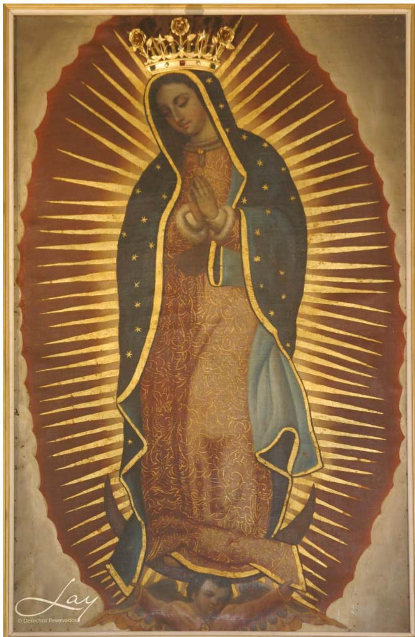
A Guadalupei Szüzanya