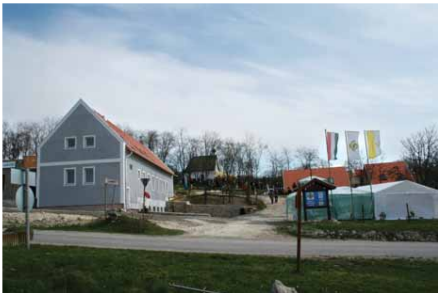
A képzőközpont a szentelés napján