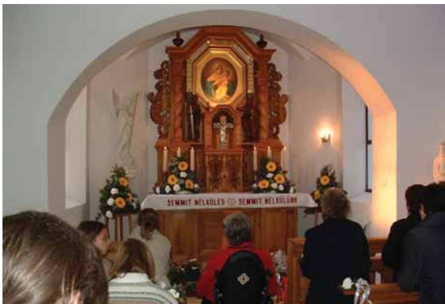
Elidőzés a szentélyben

törekszik, hanem elsősorban Máriának, Schönstatt kegyelmi anyjának kezdeményezésére, az Ő anyai és nevelői együttműködésével és az általa közvetített hathatós kegyelmek segítségével. Úgy mondják ezt a schönstattiak, hogy szeretetszövetséget kötöttek Máriával. Néhány száz ember a saját lelki erejét összegyűjtve meghívta ide a Szűzanyát. Ez a kegyelmi háttér ma is él és működik. Ezt hirdeti az oltárterítőn a felirat: „ Semmit nélküled, semmit nélküünk! ”