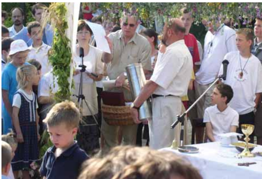
A hengerbe kerülnek a dokumentumok