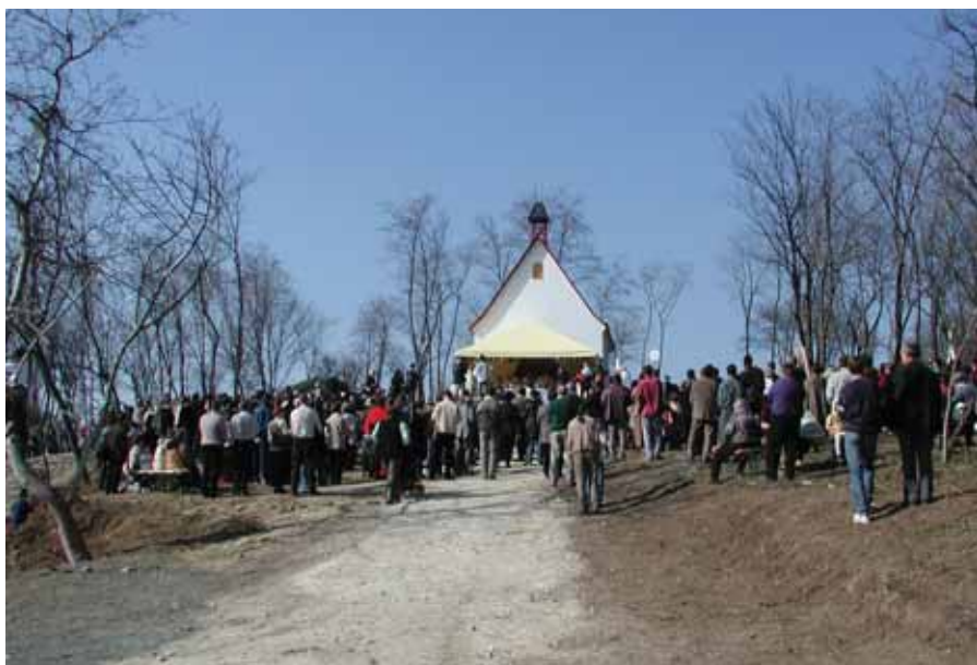
A kápolnaszentelésre összegyűlt sokaság