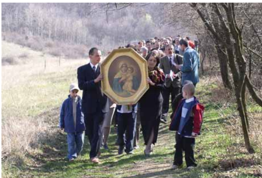
Az MTA-kép felhozatala a nagyházból körmenetben