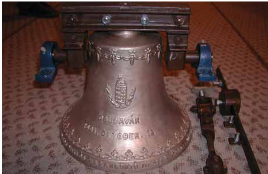
A kápolna harangja