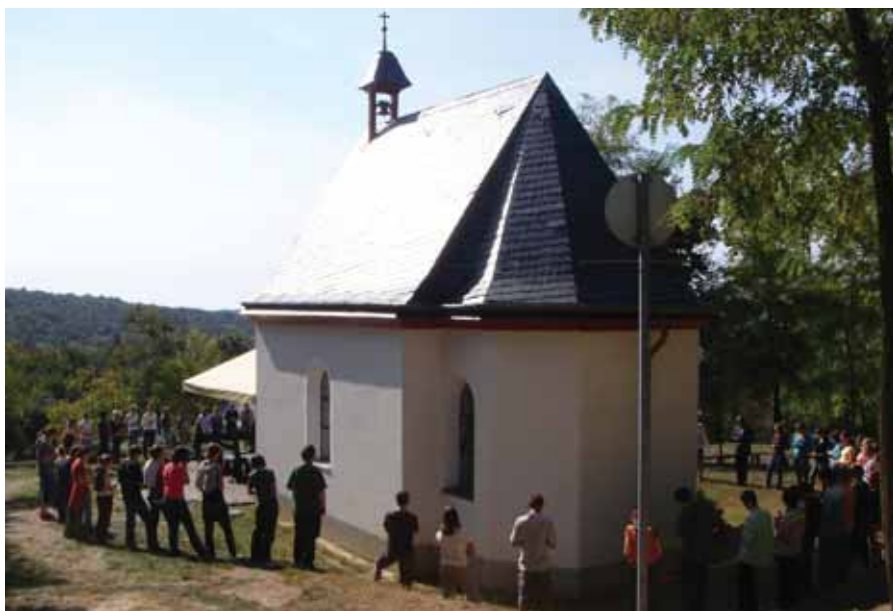
Ifjúsági találkozó 2009-ben

„Annál nagyobb apostoli tettet kétségtelenül nem vihetünk véghez, utódainkra annál drágább örökséget nem hagyományozhatunk, mint hogy Úrnőnk és Nagyasszonyunkat arra készítetjük, hogy különleges módon üsse fel trónját, ossza kincseit és művelje a kegyelem csodáit.” (1914. X. 18., Alapító okirat)