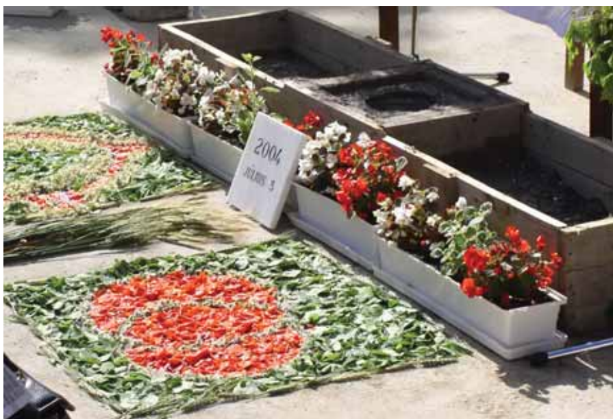
Az alapkö elhelyezés előtt