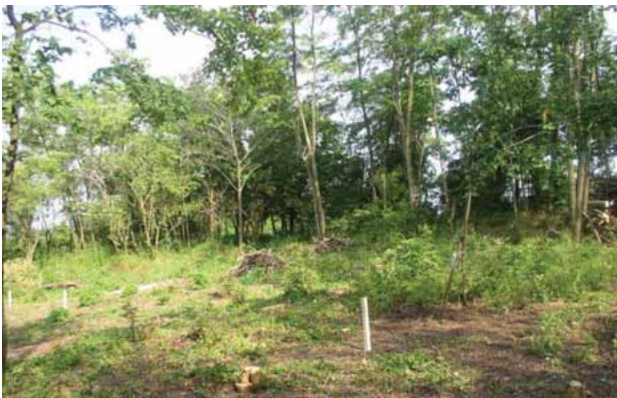
A kápolna helye a bozótirtás után