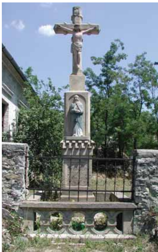
Kőkereszt a kultúrház mellett