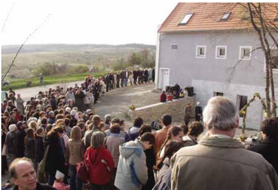
Élő kör a képzőház körül