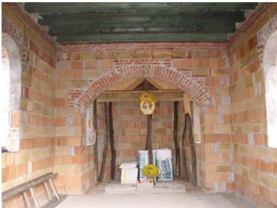
A készülő kápolna

Július végén a teljesen legyengült férj és apa kívánságára eljöttek családnapokra, együtt volt a négygyermekes család. Az oltárkép előtt készült róluk egy fénykép, mielőtt elmentek Óbudavárról. Az apa néhány nap múlva, augusztus 9-én költözött át az örök hazába. A fényképet pedig jó fél évvel később elhelyeztük az oltár alatti dobogóban.” (Bejegyzések a krónikából)