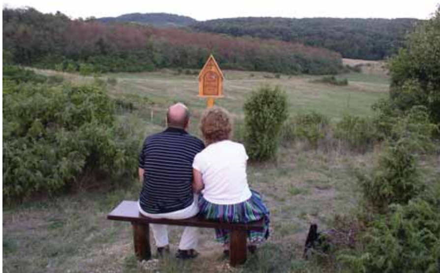
Elidőzés a házaspárok útján

„Feleségemmel együtt nehéz belső válsággal küszködtünk hónapok óta. Barátaink tanácsára elzarándokoltunk Óbudavárra. A Házaspárok útját kezdtük együtt járni és imádkozni. Még a feléig sem értünk, amikor leomlottak közöttünk a falak és újra egymásra találtunk.”