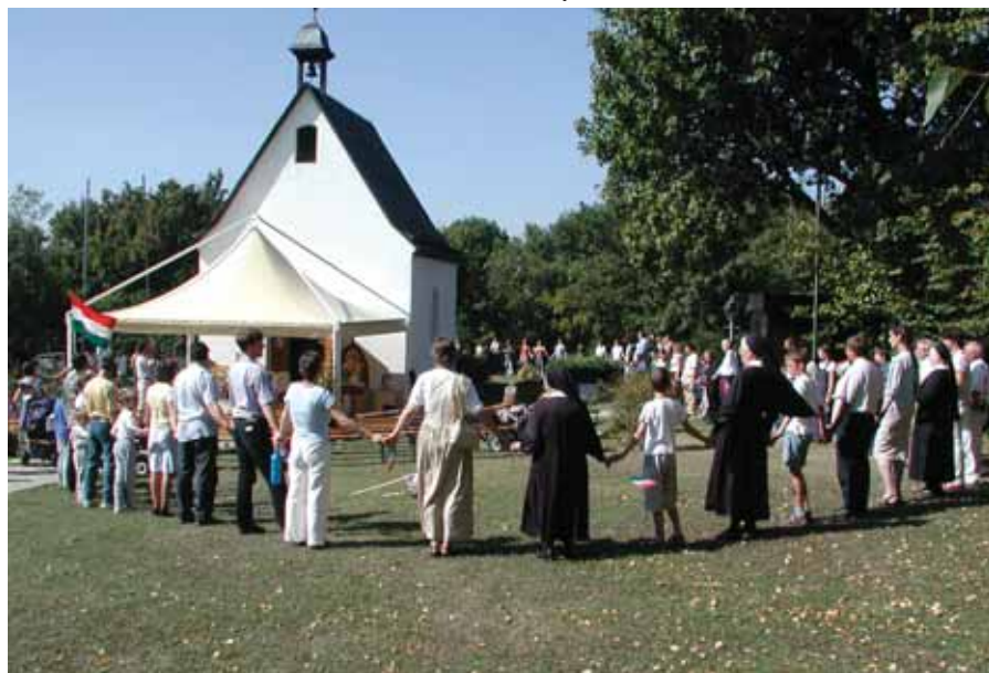
Zarándoklat a Kahlenbergen