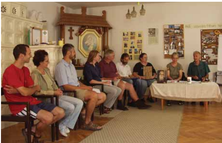
Szentély a „nagyházban”